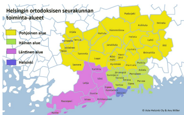
Kuva 2. Toiminta-alueiden jäsenmäärät 31.12.2023